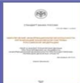
(СТО БР 1.3)