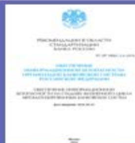
(РС БР 2.6)