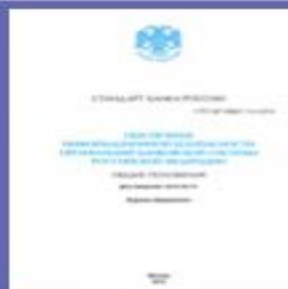
(СТО БР 1.0)