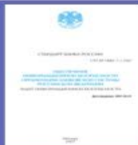
(СТО БР 1.1)