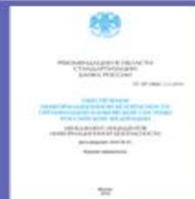
(РС БР 2.5)