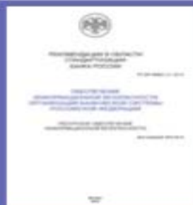
(РС БР 2.7)